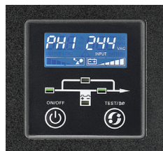
Display LCD con información clara del estatus y mediciones del UPS